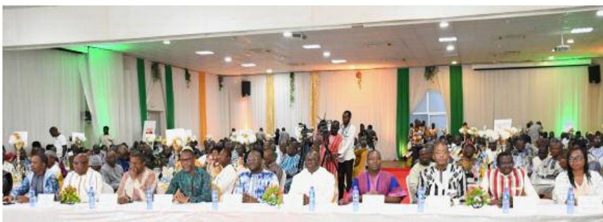
UNE VUE DES PARTICIPANTS A LA CEREMONIE (LES MINISTRES AU PREMIER RANG)