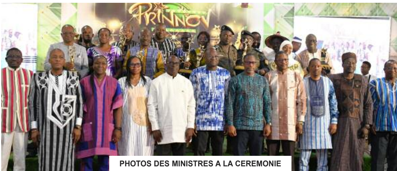
PHOTOS DES MINISTRES A LA CEREMONIE