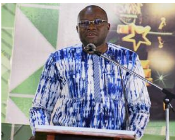
LE MEF (Dr Aboubacar NACANABO) lors de son discours (Présentation du rôle et la place de l'Innovation du Ministère de l'Economie et des Finances).