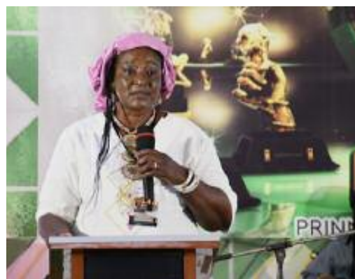
Madame la Présidente du comité de coordination lors de son message de bienvenu (C.T. ZAGRE/RINGTOUMDA Léa)