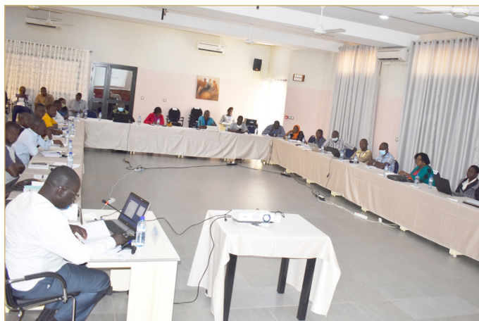
Une vue des Participants ...

Comme si cela ne suffisait pas, depuis le premier trimestre de 2020, les pays du G5 Sahel comme les autres Etats de la planète sont touchés par la pandémie du Coronavirus. « Cette maladie a un impact dévastateur sur les économies des pays du G5 Sahel déjà fragiles et mises à rude épreuve par les défis sécuritaires et de changement climatique » a-t-elle poursuivi avant d'ajouter que dans un tel contexte, « l'atteinte des objectifs que s'est fixé le G5 Sahel est tributaire de plusieurs moyens d'action dont celui de la communication qui est indispensable à la lutte contre l'insécurité et à la promotion du développement » .