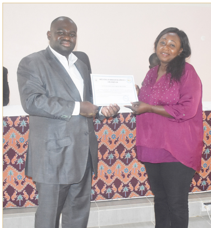
le vice president remettant une attestation à une participante